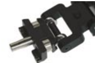
スプリングアームとベストのコネ クター