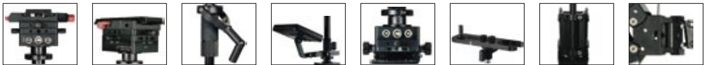
サイド・トゥ・サイド ドモジュール

アルテミスDV Proはプロのオペレーターが必要とする様々な機能を提供する世界初のカメラバランスシステムです。それは、あらゆるパーツの調整を可能にし、完璧なオペレーションをするために必要とする柔軟性を提供します。アルテミスDV Proの新案では、小型軽量のカメラでも最適なバランスが取れるよう、システムの重量バランスを適所に配置しています。素早く、極めて正確なダイナミックバランス調整を保証し、あらゆる動きに完全なバランスを提供します。