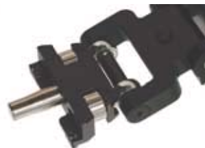
Connecteur entre le bras ressort et la veste