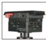
Module (arrière) „side to side“