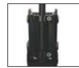
Support de bras interchangeable