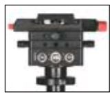
Module „side to side“

Le nouveau design de l'artemis DV pro optimise les masses et donne juste l'inertie nécessaire pour l'utilisation de caméra professionnelle légère.